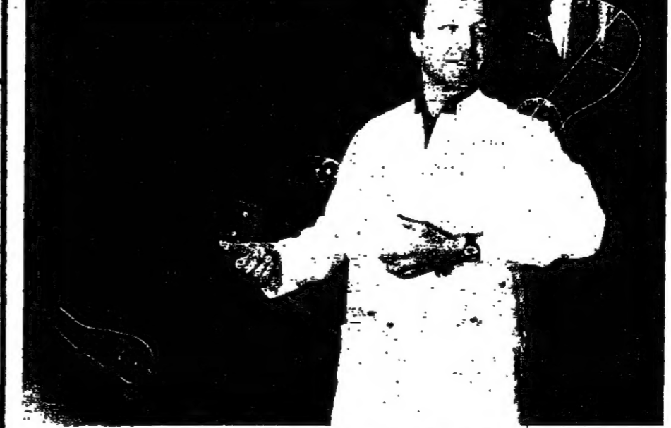
وضع العالم الألماني بالانجاس البشرية نموذجاً لمقسط اجسام السكان . يظهره اصحاب السيارات أمام عجلة القيادة .